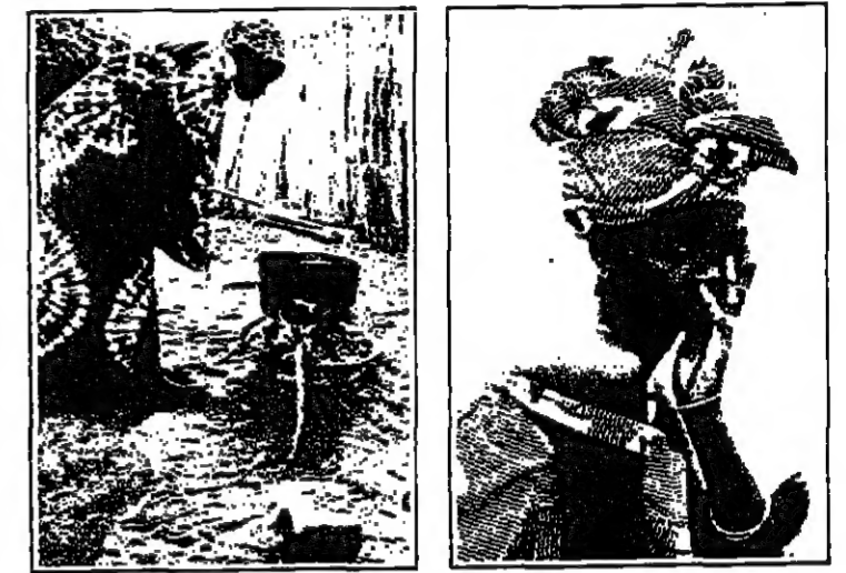
مدينا والحياة الفنية